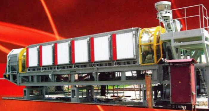
Pit furnaces Печи ямные