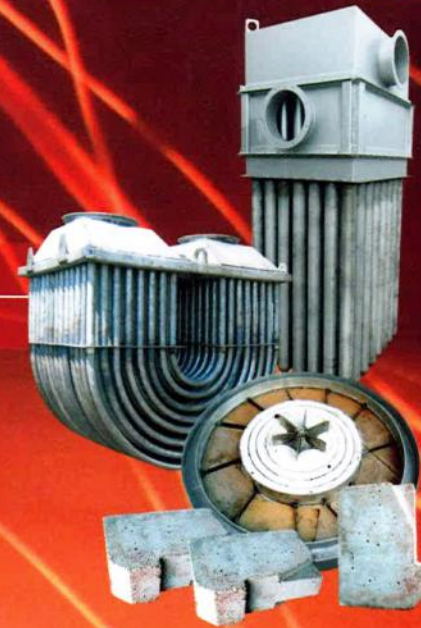
Drying furnaces Сушильные шкафы