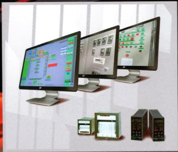
Микропроцессорные системы управления/ Microprocessors control systems