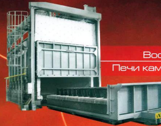
Batch furnaces Печи камерные