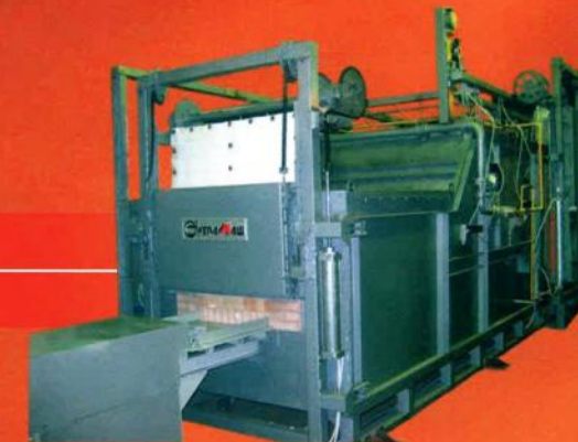
Holding furnaces Печи полуметодические