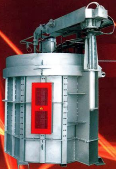
Shaft furnaces Печи шахтные