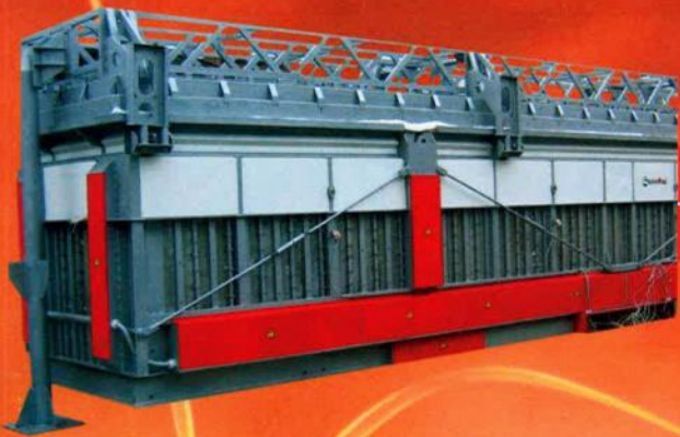
Pusher-type furnaces Печи толкательные