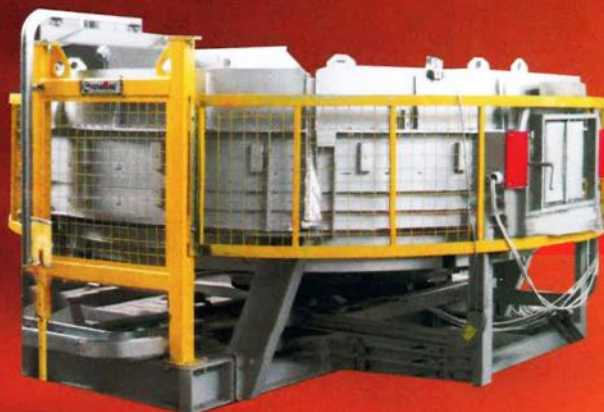
Rotary hearth furnace Печи кольцевые