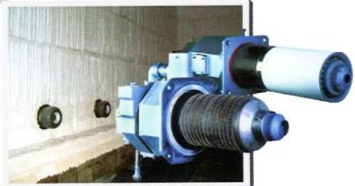
Системы нагрева/Heating systems