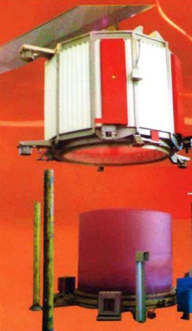
Bell-type furnaces Печи колпаковые