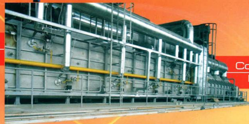
Continuous furnaces Печи проходные